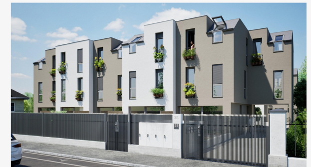
Gebäudefront - Straßenseite